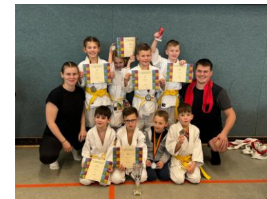
Judopokal Falkensee 2024