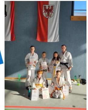
Judo & More Camp 2023