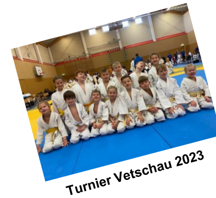
Turnier Vetschau 2023

Das Miteinander, die Zusammengehörigkeit wird schon durch die spielerische und doch anspruchsvolle partnerschaftliche Sportübung in hohem Maße geprägt.